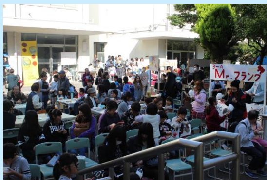
文化祭(江戸高まつり)